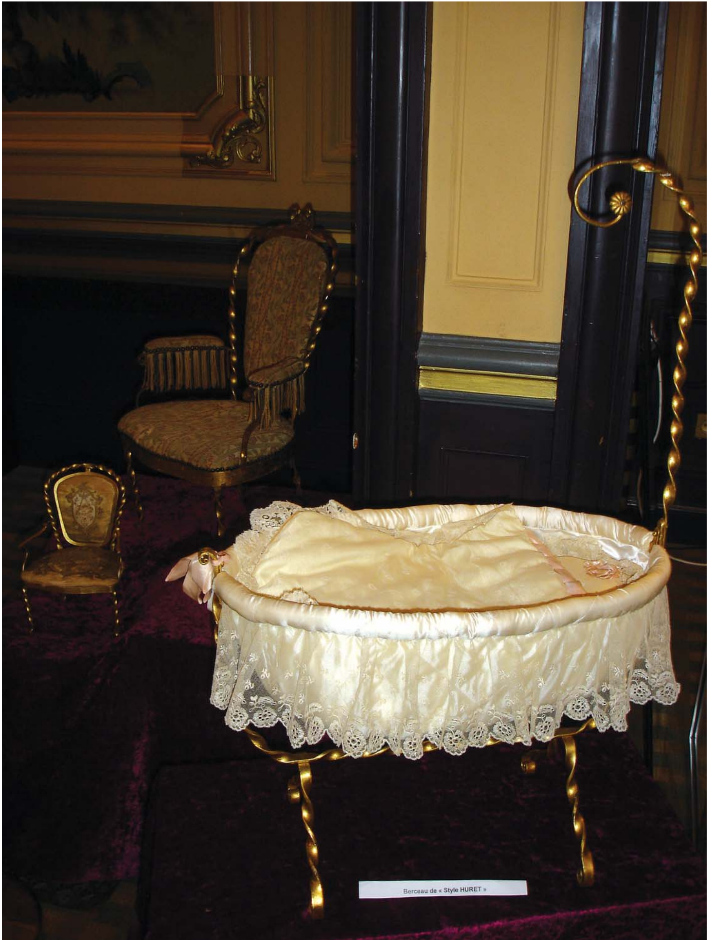
Berceau de « Style HURET »