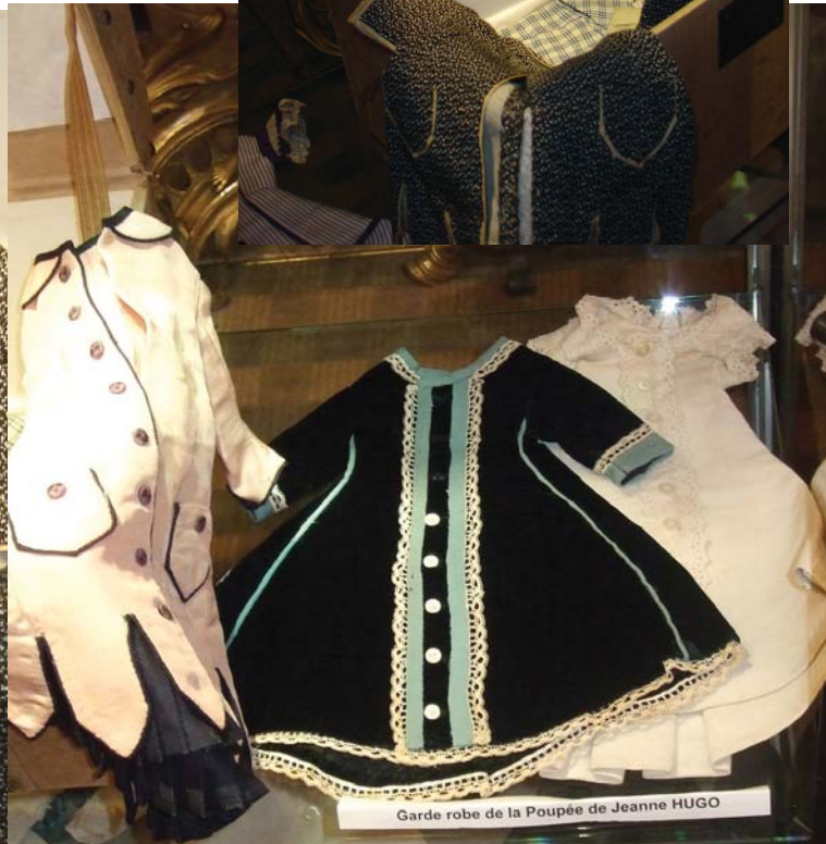
Garde robe de la Poupée de Jeanne HUGO