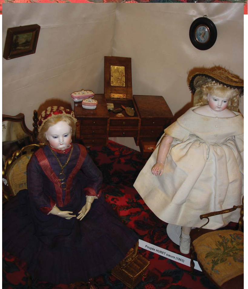
Poupée HURET saurs (1863)