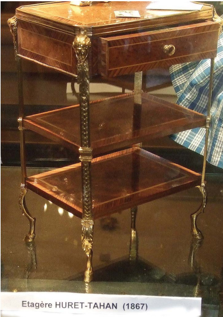
Etagère HURET-TAHAN (1867)