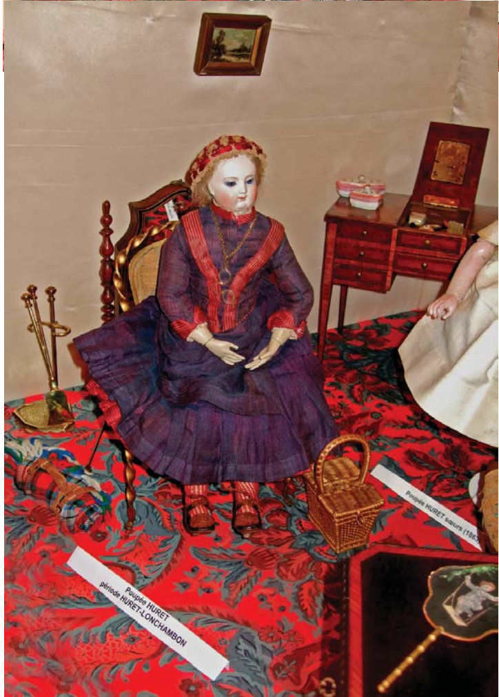
Poupée HURET saurs (1863)