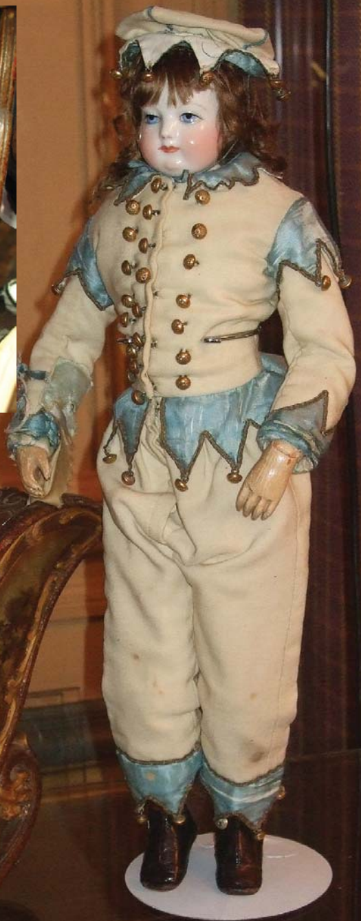
Poupée Calixte HURET avec tête buste en porcelaine