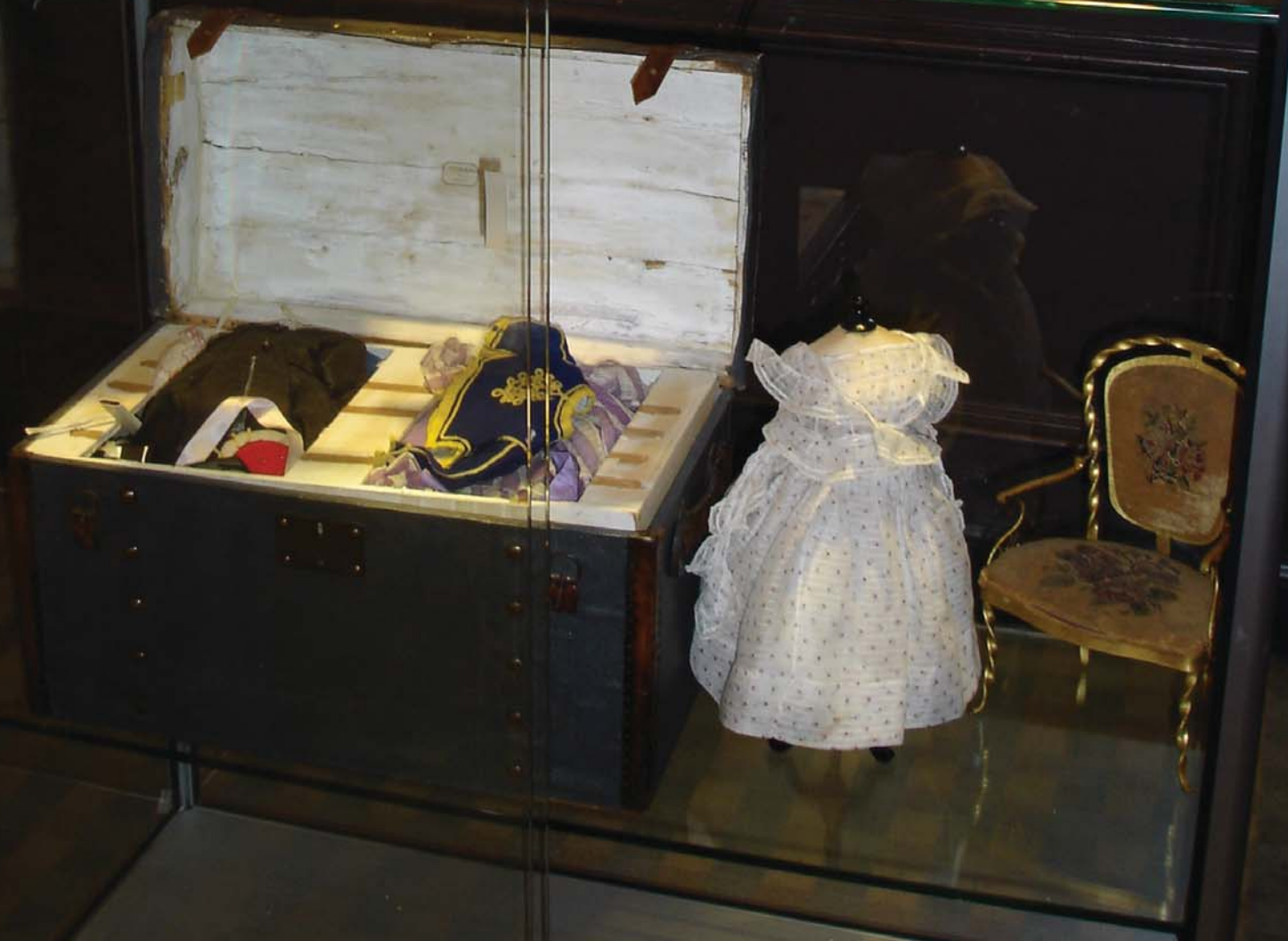
Etagère HURET-TAHAN (1867)