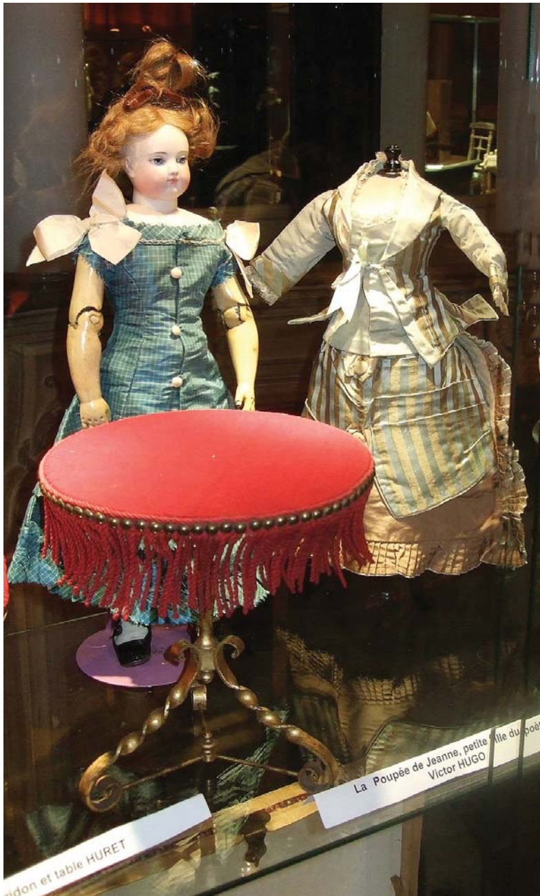
Guéridon et table HURET