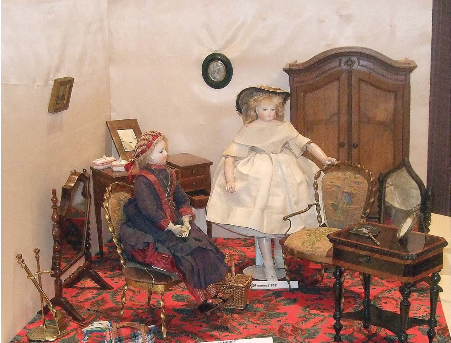
ST saurs (1863)